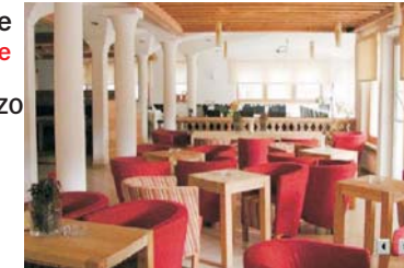
Restaurant / Bar